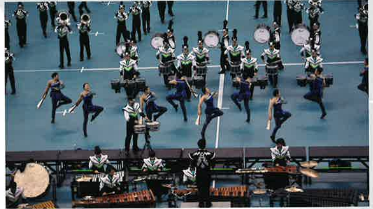
豊田市ジュニアマーチングバンド「Unconventional Tactics」

仲間みんなで積み重ねたからこそできあがる『ベストショウ』を私たちと一緒に体感してみませんか？